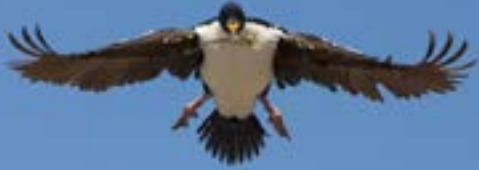
Skua (Catharacta chilensis)