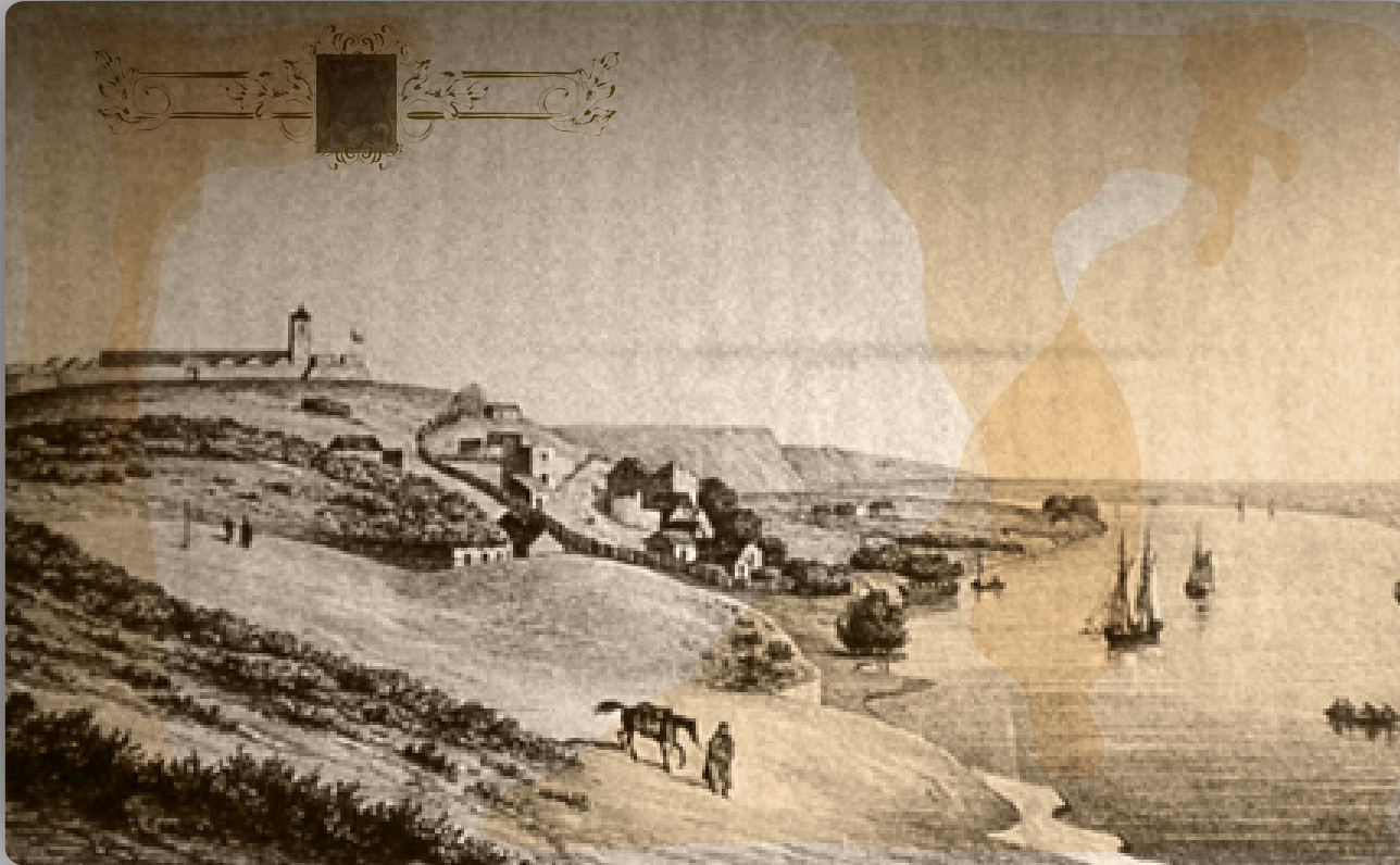
Vista panorámica de Carmen de Patagones (Argentina) 1829. Litografía de D'Orbigny

Epígrafe: Las ciudades Viedma y de Carmen de Patagones ubicadas a orillas del río Negro, comparten un origen común: el 22 de abril de 1779. Esta fundación a cargo de Don Francisco de Viedma y Narváez tenía por objetivo afianzar la soberanía hispana sobre los territorios Patagónicos.