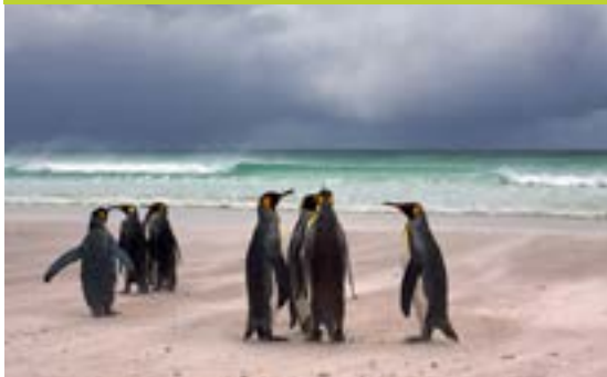
Pingüino Rey (Aptenodytes patagonicus)