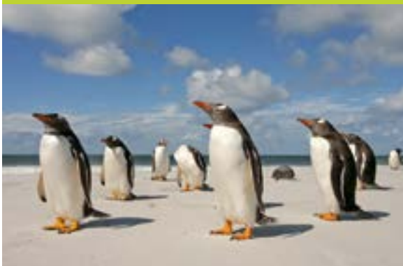
Píngüino Papúa o de vincha (Pygosceli papua)