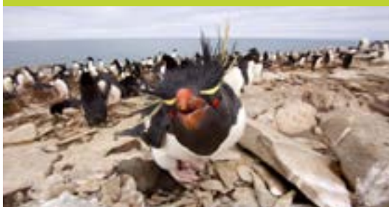
Pinguino de Penacho Amarillo del Sur ( Eudyptes chrysocome )