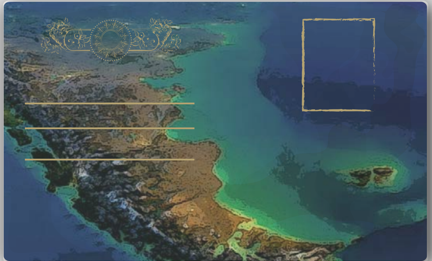
Imagen satelital de Argentina

Una gran parte de la soberanía argentina se extiende en el mar. Vivimos en un país marítimo, bicontinental y bioceánico.