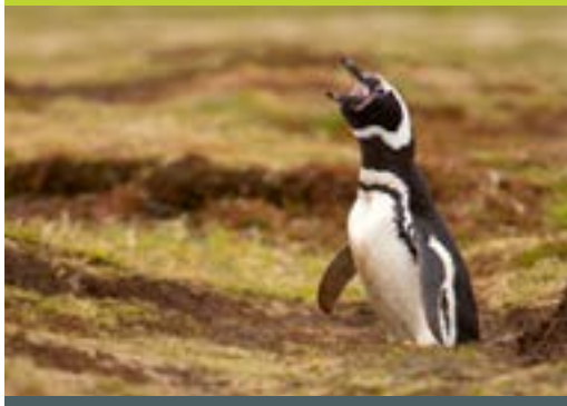
Pingüino de Magallanes ( Spheniscus magellanicus )