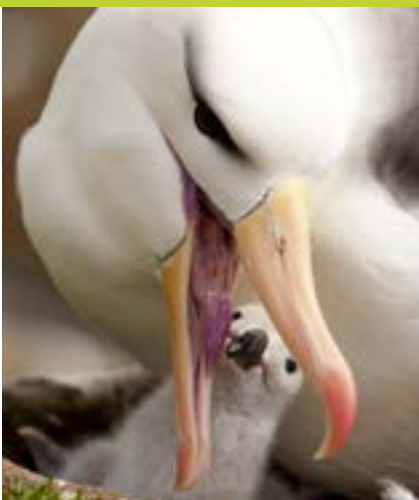
Albatros ceja negra (Thalassarche melanophry)