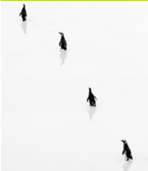
Pingüino de Magallanes (Spheniscus magellanicus)