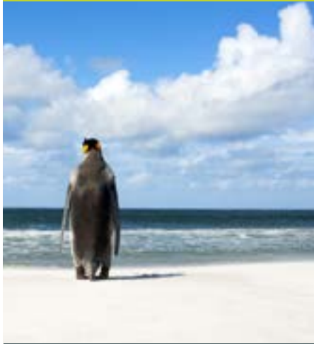
Pingüino Rey (Aptenodytes patagonicus)