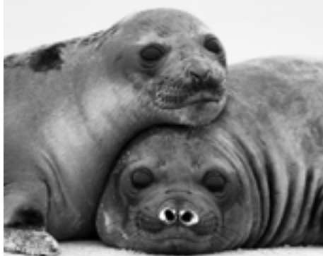
Juveniles de Elefante marino del sur (Mirounga leonina)