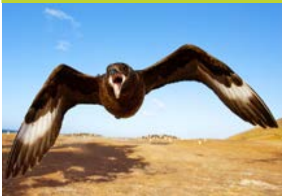
Skua (Catharacta chilensis)