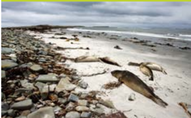
Juveniles de Elefante marino del sur (Mirounga leonina)